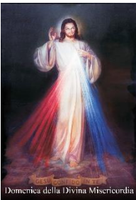
Domenica della Divina Misericordia

La domenica della Divina Misericordia richiama e celebra l'amore di Dio per l'umanità, un dono immenso rispetto al quale gli uomini sono chiamati a rinnovare la propria vita alla luce del Vangelo. La Chiesa non si stanca di annunciare questo mistero. Soprattutto nel tempo in cui ci troviamo, segnato da grandi preoccupazioni e precarietà, diventa oltremodo importante seguire il Maestro nelle piccole e grandi scelte di ogni giorno. Maria, Madre di Misericordia, interceda per noi.